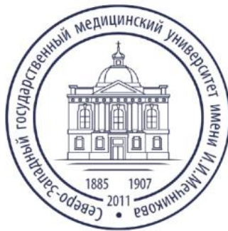
СЗГМУ имени И. И. Мечникова